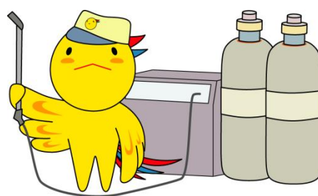
兵庫県マスコットはばタン